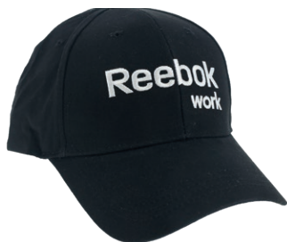
CASQUETTE REEBOK Noire