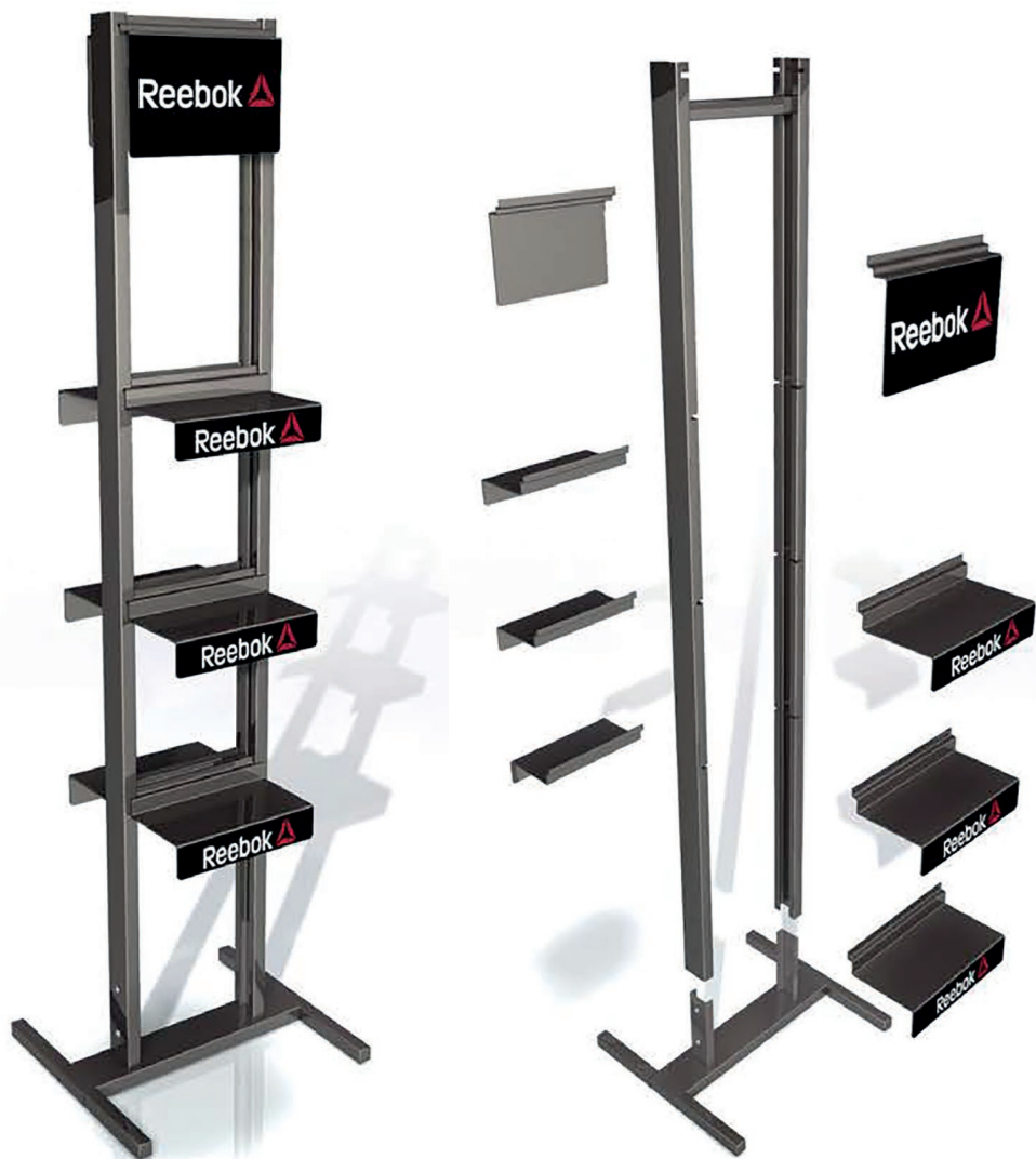
PRESENTOIR LIBRE Dimensions: 50 x 50 x 160 cm

Nous pouvons vous proposer les articles ci-dessous pour présenter et promouvoir la collection Reebok. Renseignez-vous pour les possibilités.