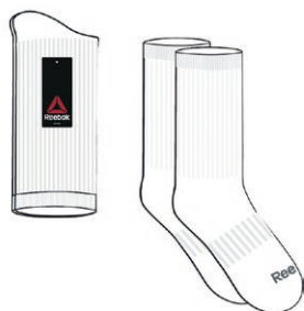
CHAUSSETTES REEBOK Blanches, emballage paire