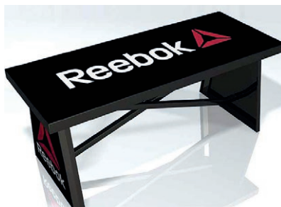
BENCH LOGO Dimensions: 106 x 43 cm