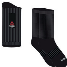
CHAUSSETTES REEBOK Noires, emballage paire