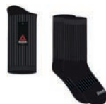
CHAUSSETTES REEBOK Noires, emballage paire