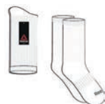
CHAUSSETTES REEBOK Blanches, emballage paire