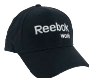
CASQUETTE REEBOK Noire