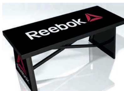
BENCH LOGO Dimensions: 106 x 43 cm