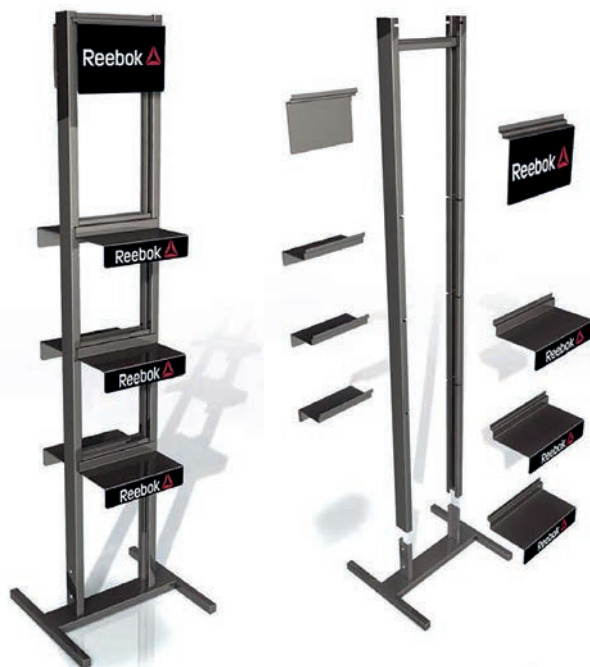
PRESENTOIR LIBRE Dimensions: 50 x 50 x 160 cm

Nous pouvons vous proposer les articles ci-dessous pour présenter et promouvoir la collection Reebok. Renseignez-vous pour les possibilités.