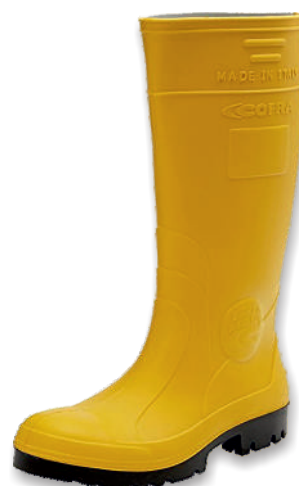
Bottes (PU) 35385 Tailles: 37 à 48 EN 20345 S5