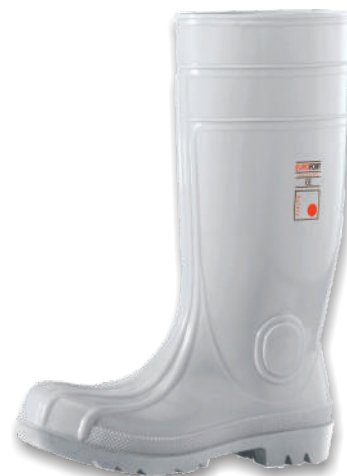
Bottes EUROFORT (PVC/NITRILE) 5.50.060 Tailles: 37 à 48 EN 20345 : 2011 S5