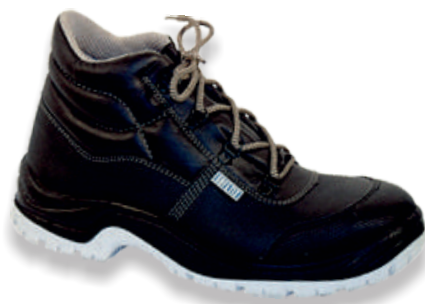
STORMIX MID STORMIX-H- Tailles: 35 à 48 EN 20345 S3 SRC