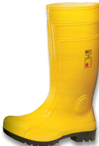
Bottes EUROFORT (PVC/NITRILE) 5.50.040 Tailles: 37 à 48 EN 20345 : 2011 S5