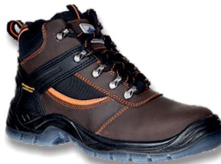
MUSTANG FW69BBR Tailles : 38 à 48 EN 20345 S3