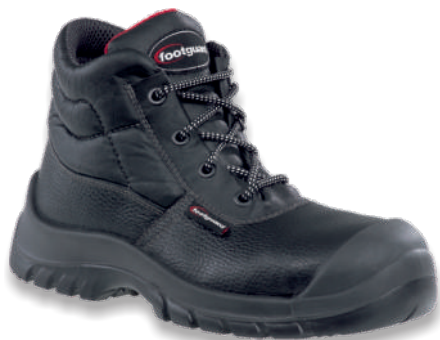
COMPACT MID 631800 Tailles: 36 à 47 EN 20345 S3