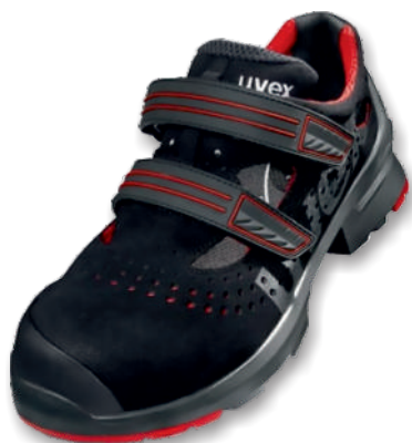
UVEX 1 8536.2 Tailles: 35 à 52 EN 20345 S1 P SRC