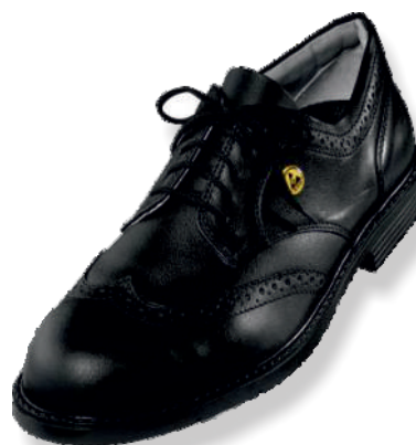
XENOVA OFFICE 9541.9 Tailles: 38 à 47 EN 20345 S1 SRA