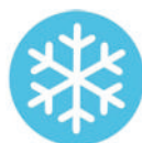
Bottes BJORN BJORN Tailles: 39 à 47 EN 20345 S5 SRC