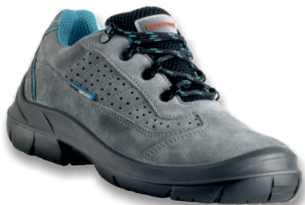
BACOU ACANTO 6246107 Tailles: 35 à 49 EN 20345 S1P HI CI SRC