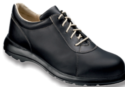
TEMPTATION 126 6551126 Tailles: 35 à 42 EN 20345 S3 SRC