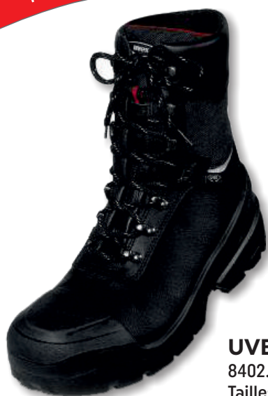
UVEX QUATRO PRO 8402.2. Tailles: 38 à 50 EN 20345 S3 CI SRC