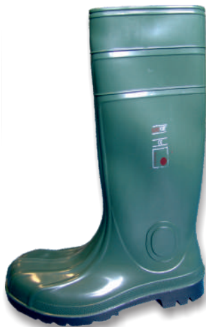
Bottes EUROFORT (PVC/NITRILE) 5.50.050 Tailles: 37 à 48 EN 20345 : 2011 S5