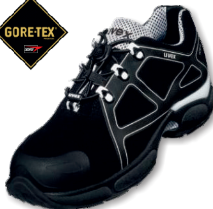
XENOVA ATC 9503.2. Tailles: 35 à 50 EN 20345 S3 WR SRC