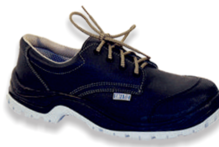
STORMIX LOW STORMIX-B- Tailles: 37 à 48 EN 20345 S3 SRC